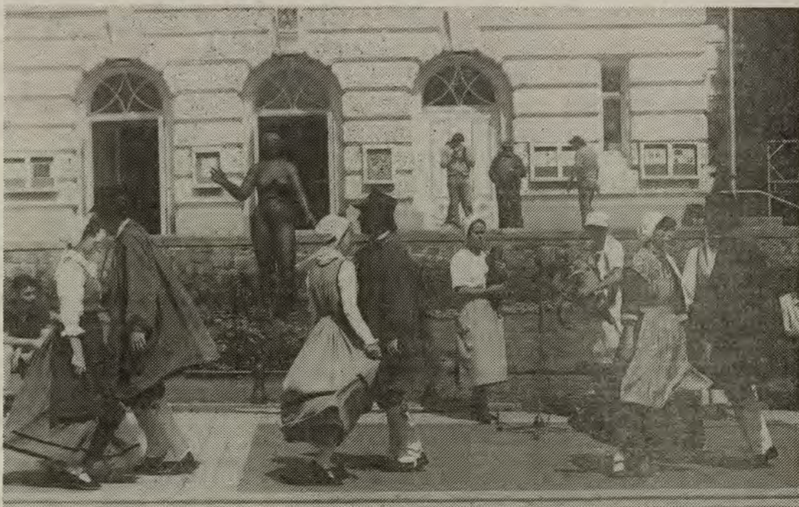
En folkloregruppe fra Vierzon livede op i Rensborgs indre by.

menneskelige forbindelser. Især det kulturelle program lever op i Rensborgs indre by og vil give yderligere kulør. En folkloregruppe fra Vierzon, Sværdansere, pantomime-aktører og kunstnere mødes her indtil weekenden. De sportslige konkurrencer omfatter bl. a. golf, ridning, roning, judo og karate. Der var også konkurrencer i alle discipliner med store og små bolde.