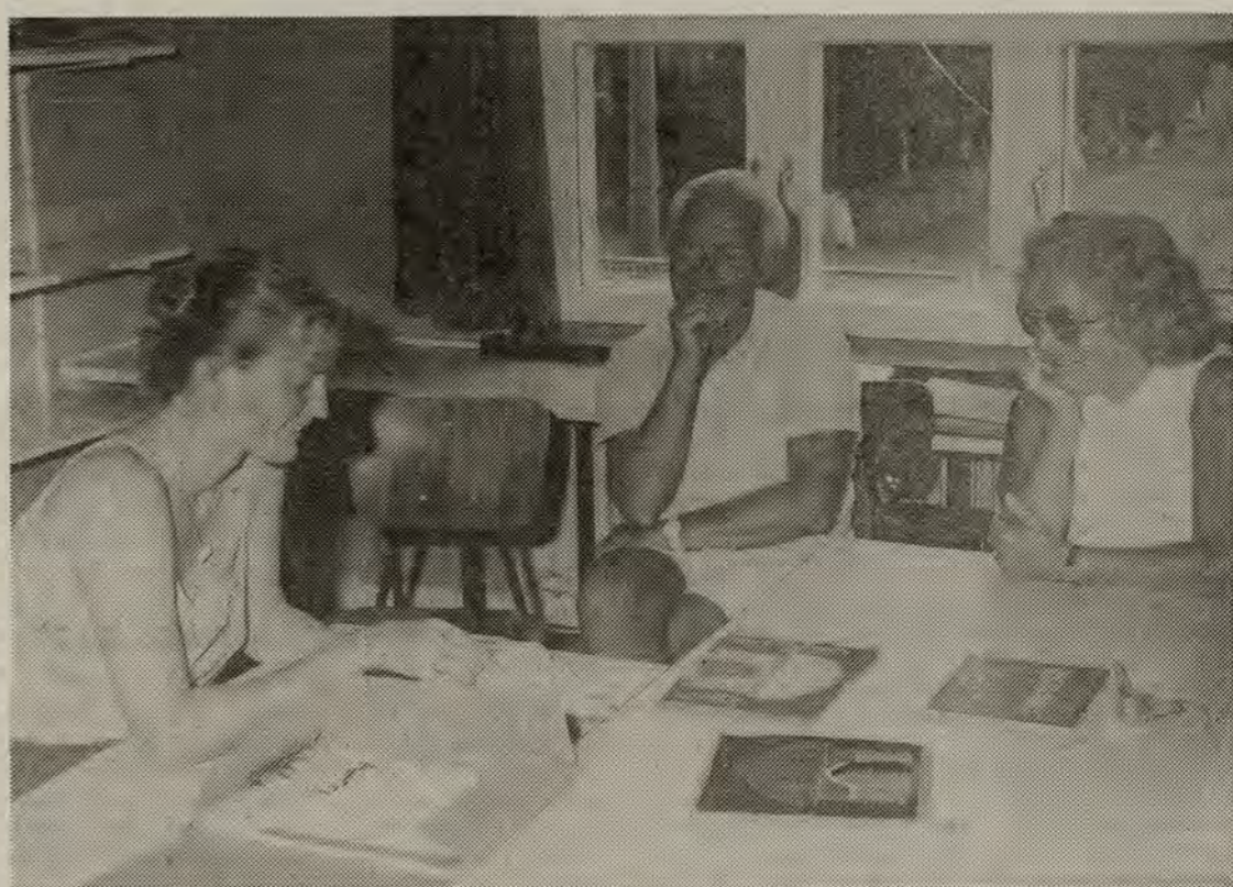
Billedvævning er ikke så nem, som man skulle tro. Men først gælder det nu om at finde et passende motiv, og det kan man jo spekulere lidt over.

— Sommerhøjskolen kunne gennemføres takket været støtte fra SSH, Grønseforbundet, TM-fonden, SSF og SdU, siger han, lige så afslappet, venlig og tilfreds med sig selv og ugen, der gik, som alle andre, der deltog i sommerhøjskolen i Vesterland... —ich