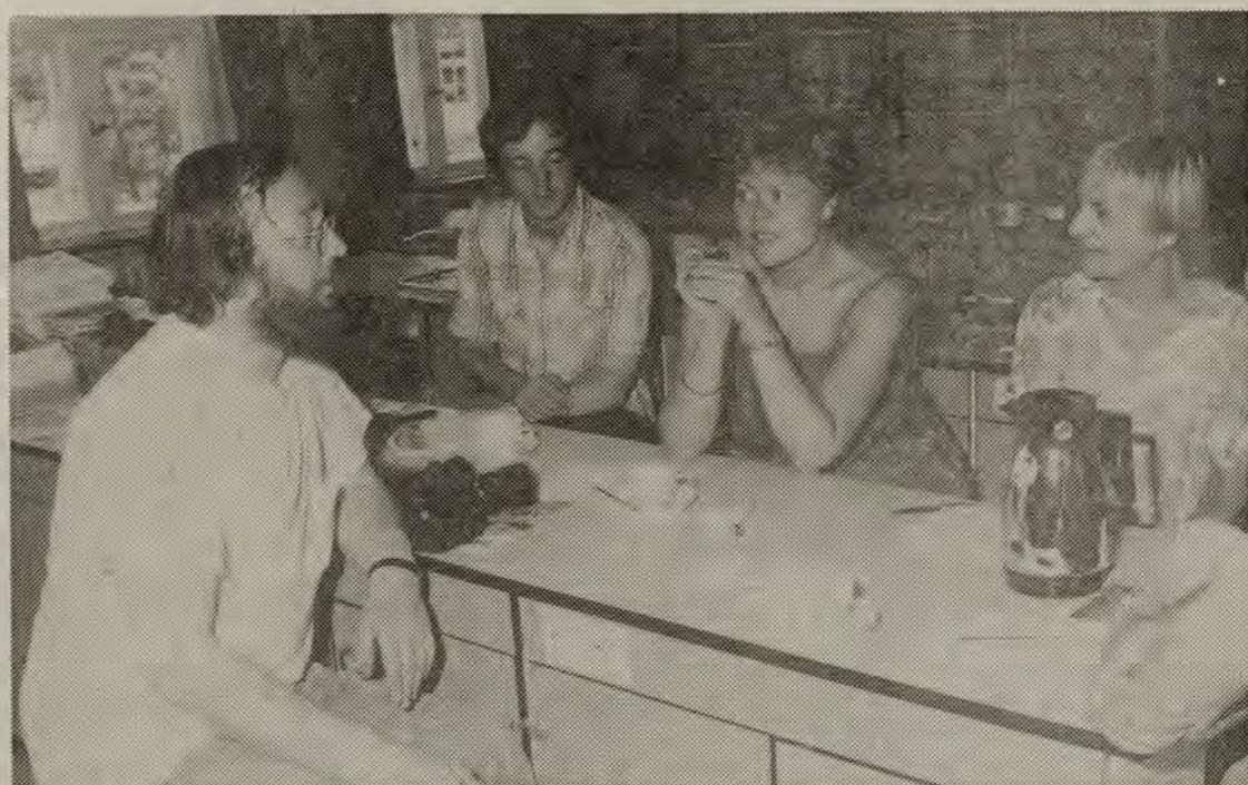
En kaffepause er der også brug for fra tid til anden. Heller ikke fotoarbejdet skal være stressende. Det skal foregå under afslappede forhold, sådan som det bør være på en sommerhøjskole.