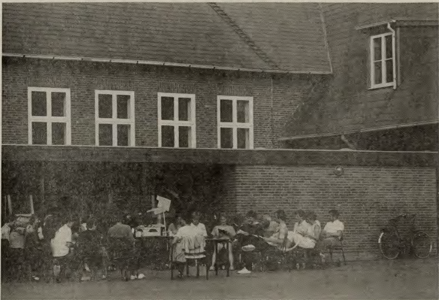
Høj himmel og sol - arbejde under afslappede forhold. Det le vende ord og højskolesangbogen har gode kår